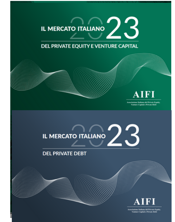
DATI DI MERCATO E RICERCHE