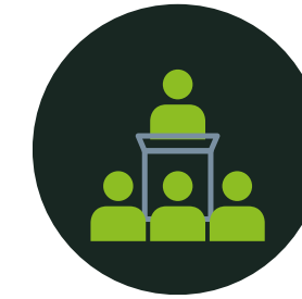
PRIVATE CAPITAL CONFERENCE