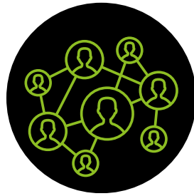
MEETING CON GLI INVESTITORI ITALIANI E INTERNAZIONALI