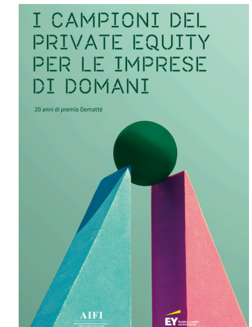
PUBBLICAZIONI SUL SETTORE