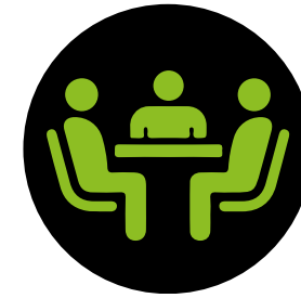
ASSEMBLEA DEI SOCI