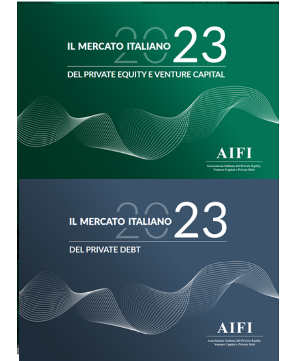
DATI DI MERCATO E RICERCHE