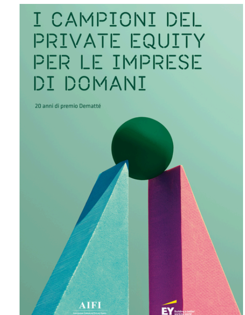
PUBBLICAZIONI SUL SETTORE