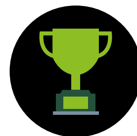
PRIVATE DEBT AWARD