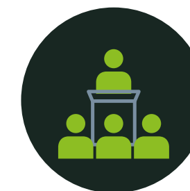
PRIVATE CAPITAL CONFERENCE