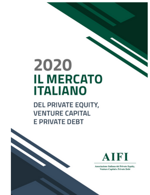
DATI DI MERCATO E RICERCHE