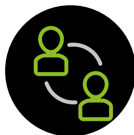
MEETING CON GLI INVESTITORI ITALIANI E INTERNAZIONALI