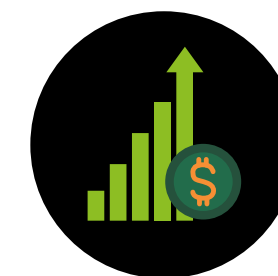
PRESENTAZIONE DATI DI MERCATO E PERFORMANCE